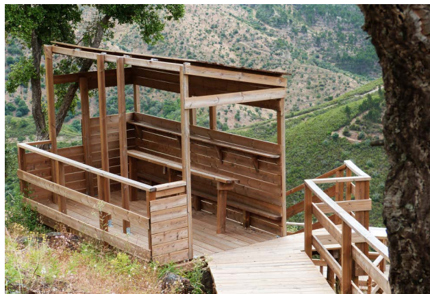
03 ENQUADRAMENTO DA ESTRUTURA