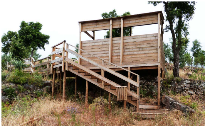
02 ESTRUTURA EM MADEIRA