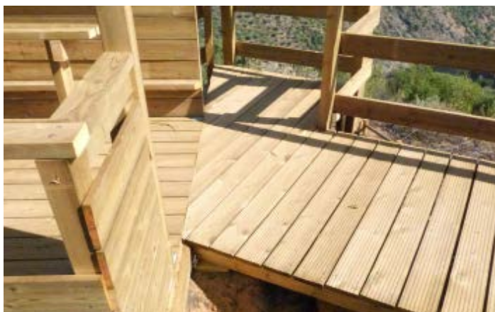
05 PORMENOR DE CONSTRUÇÃO