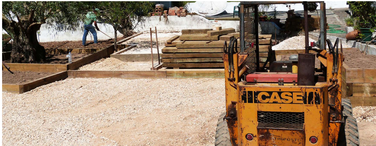
06 EQUIPAMENTOS E MATERIAIS