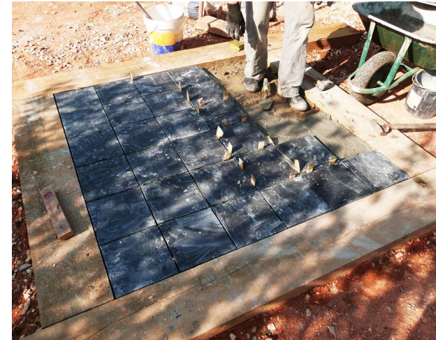
04 CENTRO DE FOGO EM XISTO