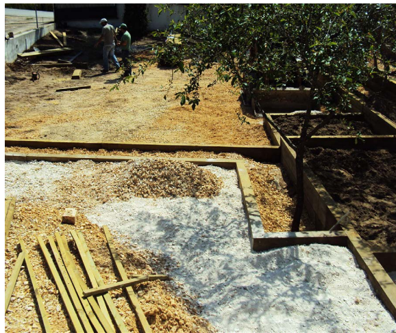
03 LIMITES EM CHULIPAS DE MADEIRA